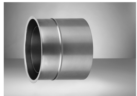
Doppeltes Wandfutter passend für doppelwandiges Rauchrohr