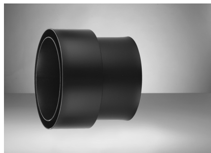
Wandanschlussstück ohne Rosette (zum Anschluss an ein herkömmliches doppeltes Wandfutter DN 150)